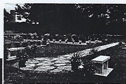
Emplacements deux ou quatre urnes Cimetière St-Charles